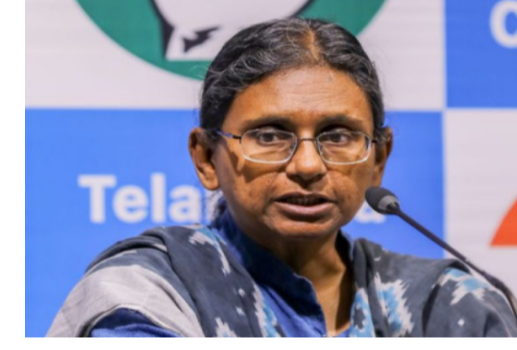
తిరస్కరించారు. అయితే, రెండేళ్లకు పైగా శిక్ష పడే అవకాశం ఉన్న కేసులు వివరాలు మాత్రమే వెల్లడించాలి ఉంటుందని, ఈ కేసులో కేవలం సమస్య మాత్రమే జారీ అయ్యాయని ఆమె తరఫు న్యాయవాది అభిషేక్ మను సింఘ్ వాదించారు.