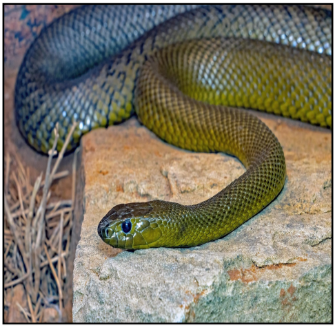
ప్రపంచంలోనే అత్యంత విషపూరితమైన పాము ఇదే... రంగులు కూడా మార్చుతుంది!