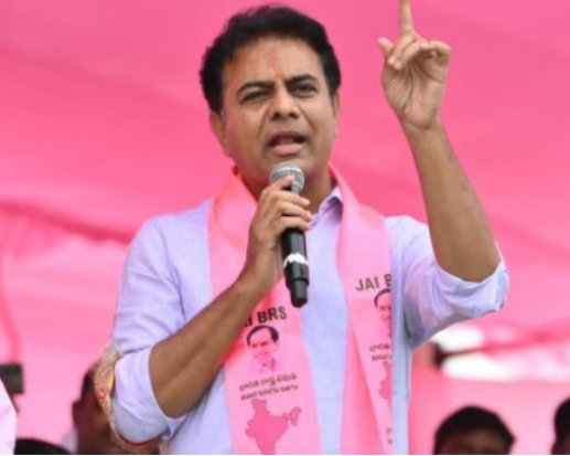
అప్పటికే ఉన్న హైదరాబాద్ నగర సమస్యలను పరిష్కరించకుండా భవిష్యత్ నగరాల పేరుతో ప్రజలను మభ్యపెట్టే ప్రయత్నం జరుగుతోందన్నారు.

ఎక్కువ ప్రాధాన్యత ఇస్తున్నారని ఆరోపించారు. ఇప్పటికే ఉన్న హైదరాబాద్ నగర సమస్యలను పరిష్కరించకుండా భవిష్యత్ నగరాల పేరుతో ప్రజలను మభ్యపెట్టే ప్రయత్నం జరుగుతోందన్నారు. తాజాగా కురిసిన వర్షాలతో నగరంలో ఏర్పడిన పరిస్థితులు ప్రభుత్వ వైఫల్యాన్ని బయటపెట్టాయని వ్యాఖ్యానించారు. అలాగే, కేంద్రం తీసుకురావచ్చు డీబిఎస్ఎస్ ప్రక్రియపై కూడా ఆయన అందోళన వ్యక్తం చేశారు. దక్షిణాది రాష్ట్రాల ప్రాతినిధ్యం తగ్గకా నిర్ణయాలు తీసుకుంటే టిజీపీని తీవ్రంగా వ్యతిరేకిస్తుందని హెచ్చరించారు. దేశ అభివృద్ధిలో తీలక పాత పోషిస్తున్న రాష్ట్రాలకు అన్యాయం జరుగుతుందా చూడాలని బాధ్యత కేంద్రంపై ఉంచిన కేటీఆర్ స్పష్టం చేశారు.