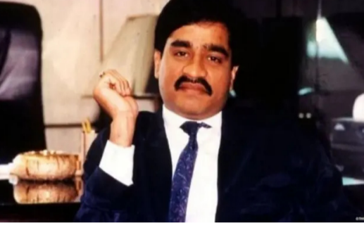
భయాందోళనలను కలిగించడమే వీరి ప్రధాన వ్యూహంగా కనిపిస్తోంది. ఎవరినైనా లక్ష్యంగా చేసు కోవచ్చునే హెచ్చరికలను పంపి, స్థానికంగా తీవ్ర గందరగోళం సృష్టించాలని వారు యత్నిస్తున్నారు.