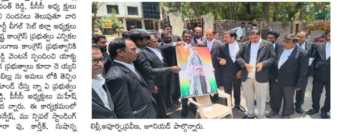
లిల్లి అభివృద్ధి ప్రవీణ, జూనియర్ పాల్గొన్నారు.