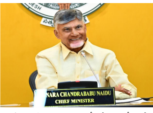
ఆకాంక్షించారు. కూటమి ప్రభుత్వం రెండేళ్ల పాలనపై కేంద్ర పౌర విమోచన కార్యక్రమం మంత్రి కిషోర్రావు రామ్మోహన్ నాయుడు కూడా

మొదటిసారి తరువాతి - సమృద్ధం. ప్రతి పౌరుడు, ప్రతి కుటుంబం, సమాజంలోని ప్రతి వర్గం విజయం, శ్రేయస్సు మా వెంజెండా. వారి ఆశలు, ఆకాంక్షలను నెరవేరుస్తూ రాష్ట్ర భవిష్యత్తుకు బాటలు వేస్తున్నాం" అని చంద్రబాబు అన్నారు. ఈ రెండేళ్ల ప్రయాణంలో కేంద్ర ప్రభుత్వ సహకారానికి ఆయన ప్రత్యేకంగా కృతజ్ఞతలు తెలిపారు. "రాష్ట్ర అభివృద్ధికి ప్రతి అడుగులో అందగా నిలుస్తున్న ప్రధాన నేరేంద్ర మోడీకి, కేంద్ర ప్రభుత్వానికి ప్రజల ఆభివృద్ధికి కృతజ్ఞతలు తెలిపారు. కేంద్ర ప్రభుత్వ సహకారంతో, డిప్యూటీ సీఎం పవన్ కల్యాణ్ భాగస్వామ్యంతో 'స్వచ్ఛంద' దిశగా పయనిస్తున్నాం" అని ఆయన పేర్కొన్నారు. తమకు అందగా నిలిచిన రాష్ట్ర ప్రజలకు హృదయపూర్వక ధన్యవాదాలు తెలుపుతూ, భవిష్యత్తులో చేపట్టబోయే అభివృద్ధి, సంక్షేమ కార్యక్రమాలకు ప్రజల మద్దతు ఇలాగే కొనసాగాలని